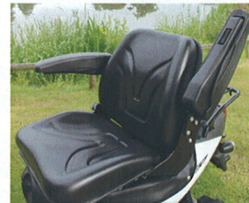
Komfortsæde med armlæn, justerbar ryghældning og af-fjedring. Sædehøjde fra 75 cm