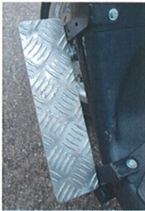
Benstøtteholder for stift ben -