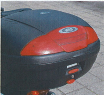
Stor aflåselig boks med god opbevaringsplads fås som tilbehør i 2 str.