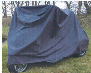
Vind- og vandtæt garage til Atlantis i 2 modeller.