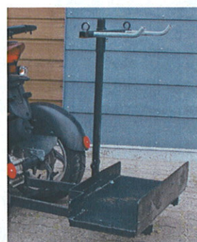
Stokkeholder m/rolator- og kørestols-holder. (TILBEHØR)

TGB leveres med en 120 liter stor boks, som også fungerer som ryglæn. Der er mulighed for at påmontere armlæn.