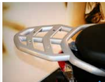
BAGGEBÆRER PEA07005, KISBEE KR. 598,-