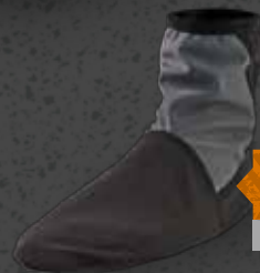
SOKKER Str. S-XXL Varenr. WK5503

Denne varme tekstilhandske fra Yoko er både vandtæt og åndbar. Den er fremstillet med Hipora-membran og blødt tekstil-for, der gør den behagelig at have på. Håndfladerne har gummibelegning, og der er forstærkninger mellem knoer og fingre.