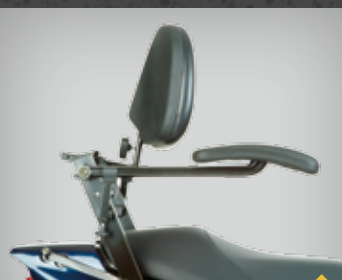
RYGLÆN MED ARMSTØTTE TIL STANDARDSÆDE C1675001000