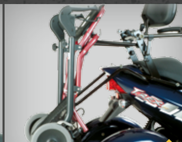
BØJLE MONTERINGSÆT TIL KØRESTOL/ROLLATOR C1675160000