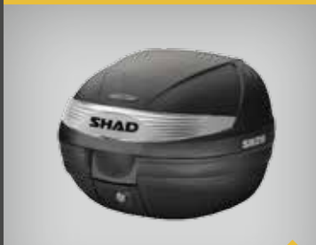
SHAD TOPBOKSE FRA 26L. TIL 40L. WSH26/29/33/37/40