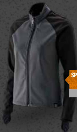
SPORT TOP / LADY Str. XS-XL Varenr. WK5508