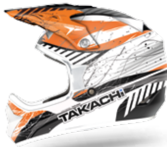
TKR265 Hvid/orange / 54-63 Varenr. W2514 898,-