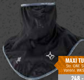
MAXI TUBE Str. ONE SIZE Varenr. WK5501