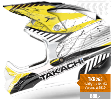
TKR265 Hvid/gul / 54-63 Varenr. W2510 898,-