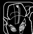
4 INSECT REMOVER