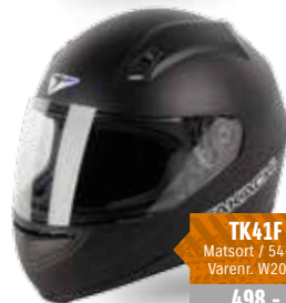
TK41F Matsort / 54-63 Varenr. W2021 498,-