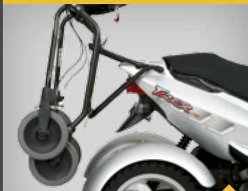
MONTERINGSÆT, KØRESTOL/ROLLATOR TRANSPORT TR3RH