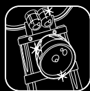
1 CHROME & ALU POLISH