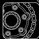
6 CHAIN CLEAN 7 CHAIN LUBE ROAD 8 CHAIN LUBE FACTORY LINE