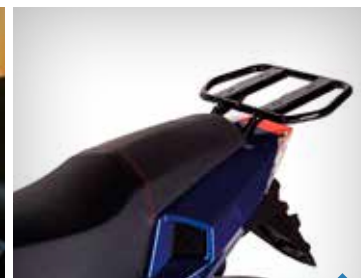
BAGGEBÆRER PEA06100, SPEEDFIGHT 3 KR. 628,-