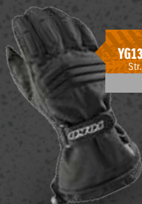
YOKO YG13 HANDSKE Str. XXS-XXXL