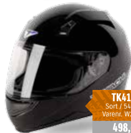
TK41F Sort / 54-63 Varenr. W2020 498,-