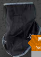
MINI TUBE Str. S-L Varenr. WK5500

De tre elementer arbejder sammen om at yde den perfekte balance: Hidtil uset beskyttelse mod vind og vejr samtidig med, at huden kan ånde, temperaturen føles behagelig og pasformen perfekt. Kombinationen af Softshell og 3D fleece tillader varm luft at cirkulere ubesværet.