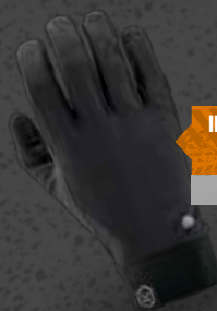
INDERHANDSKE Str. S-XXL Varenr. WK5503