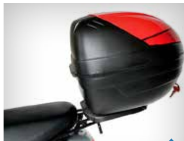
TOPBOKS LAKERET 30L & 34L PEA05641XX*, 30L KR. 898,- PEA06352XX*, 34L KR. 998,-