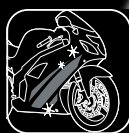
2 SHINE & GO 2 Matt surface clean