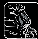
5 WASH & WAX