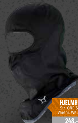
HJELMHUE Str. ONE SIZE Varenr. WK5502