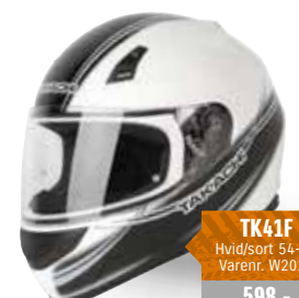
TK41F Hvid/sort / 54-63 Varenr. W2022 598,-