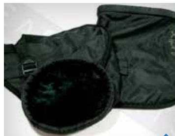
SCOOTERLUFFER PEA06915, TWEET / SPEEDFIGHT 3 KR. 398,- PEA07001, KISBEE KR. 398,-