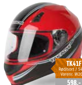
TK41F Rød/sort / 54-63 Varenr. W2025 598,-