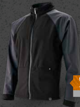
WIND BUDDY Str. S-XXL Varenr. WK5507