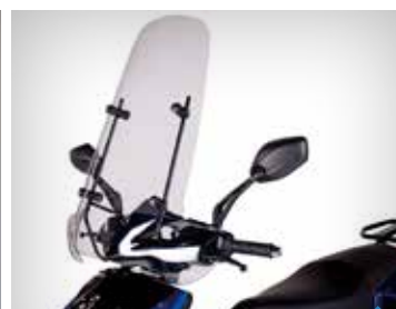
VINDSKÆRM PEA06101, SPEEDFIGHT 3, LAV KR. 998,- PEA06102, SPEEDFIGHT 3, HØJ KR. 998,-