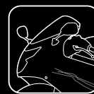
3 SCRATCH REMOVER