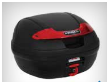
TOPBOKS ULAKERET 30L & 34L PEA05622, 30L KR. 698,- PEA06350N, 34L KR. 798,-