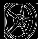
10 WHEEL CLEAN