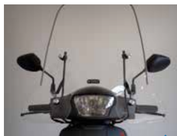
VINDSKÆRM PEA06908, TWEET KR. 998,-