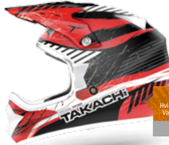
TKR265 Hvid/rød / 54-63 Varenr. W2512 898,-