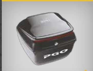
TOPBOKS 32 LITER INDFAVNET M/STOPLYS SORT: TXBB 169, SØLV: TXBB 17L