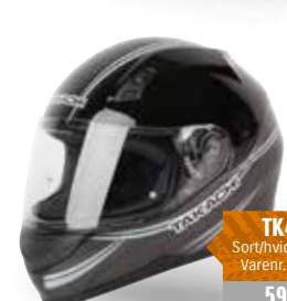
TK41F Sort/hvid / 54-63 Varenr. W2023 598,-