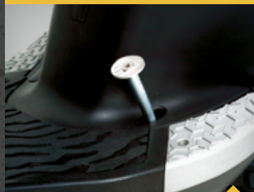
FØDBREMSESÆT, HØJRE/VENSTRE FOD TR3FBH / TR3FBV