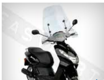
VINDSKÆRM PEA07003, KISBEE KR. 998,-