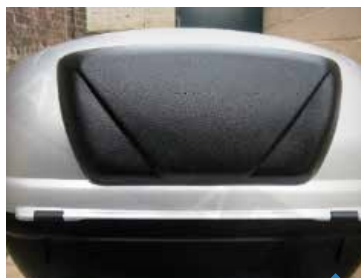
RYGSTØTTE TOPBOKS 30L & 34L PEA06216, 30L KR. 398,- PEA06353, 34L KR. 398,-