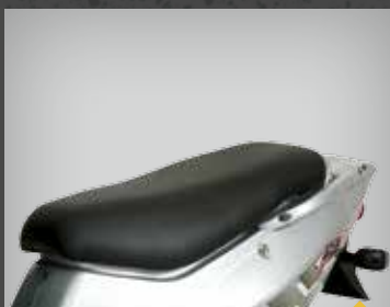
NEDSÆNKET SÆDE CA. 6 CM. TR3LS