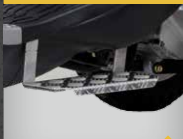
INDSTIGNINGSTRIN (HØJRE ELLER VENSTRE) TR3IT