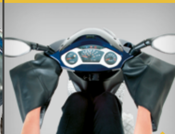
SCOOTERLUFFER "HOT HANDS" TR3SL