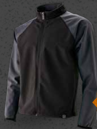
SPORT TOP / MEN Str. S-XXL Varenr. WK5505