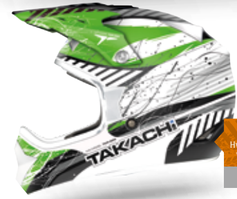
TKR265 Hvid/grøn / 54-63 Varenr. W2511 898,-