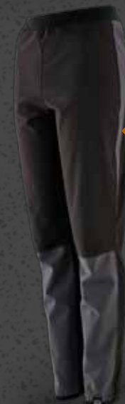
SPORTS PANTS Str. S-XXL Varenr. WK5506