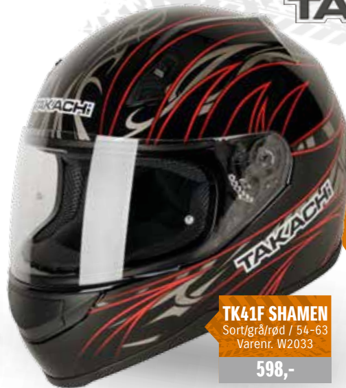
TK41F SHAMEN Sort/grå/rød / 54-63 Varenr. W2033 598,-