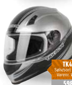
TK41F Sølv/sort / 54-63 Varenr. W2024 598,-