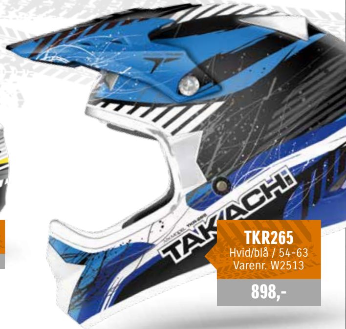
TKR265 Hvid/blå / 54-63 Varenr. W2513 898,-