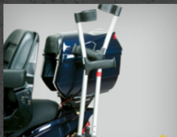
STOKKEHOLDER (DOBBELT) TR3SHN