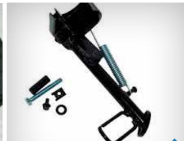
STØTTEBEN PEA07004, KISBEE KR. 238,- PEA06103, SPEEDFIGHT 3 KR. 298,-