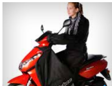
KØRESLAG PEA07002, KISBEE KR. 678,- PEA06911, TWEET KR. 898,-