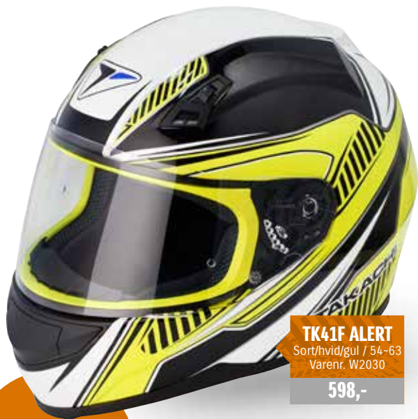
TK41F ALERT Sort/hvid/gul / 54-63 Varenr. W2030 598,-